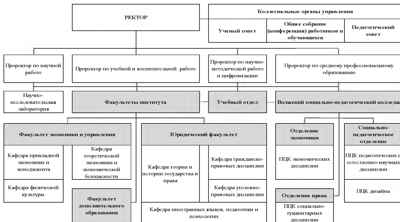
Рисунок 1 - Организационная структура управления образовательной деятельностью ВИЭПП

Организационная структура управления образовательной деятельностью ВИЭПП представлена на рисунке 1.