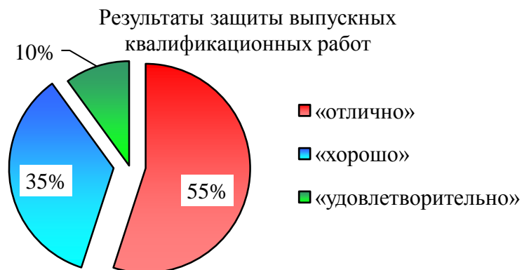
Рисунок 3 - Качественная структура государственной итоговой аттестации по ППСЦЗ по специальности 44.02.02 Преподавание в начальных классах за 2020 год

Качественная структура государственной итоговой аттестации по ППСЦЗ по специальности 44.02.02 Преподавание в начальных классах за 2020 год показана на рисунке 3.