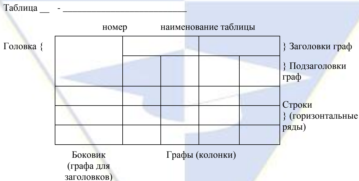
Рисунок 2 – Макет таблицы

После таблицы должно быть оставлено не менее одной свободной строки.