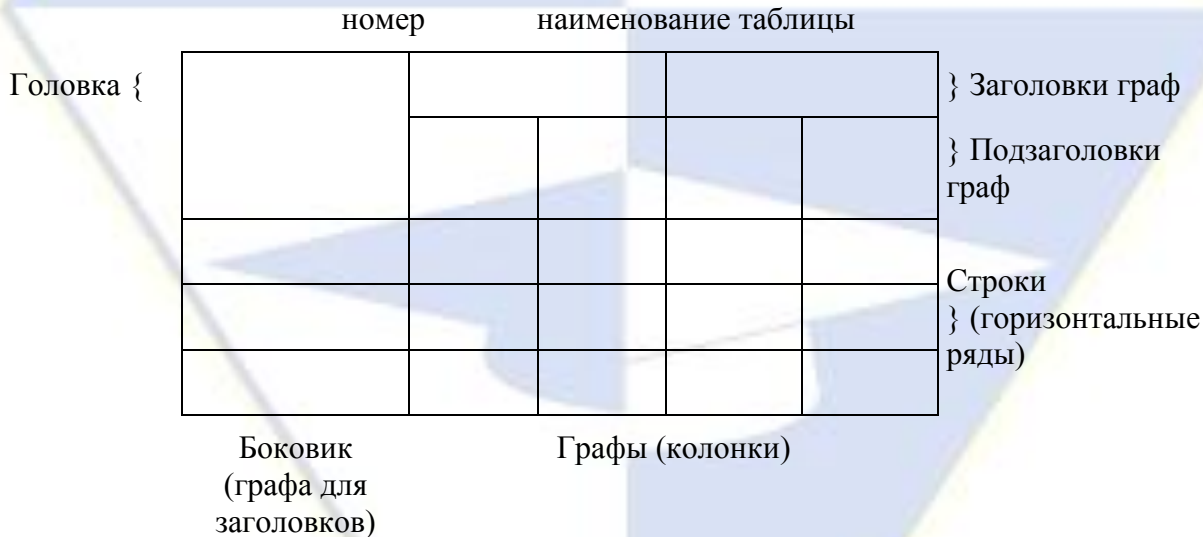
Рисунок 2 – Макет таблицы

Таблицы, за исключением таблиц приложений, следует нумеровать арабскими цифрами сквозной нумерацией.