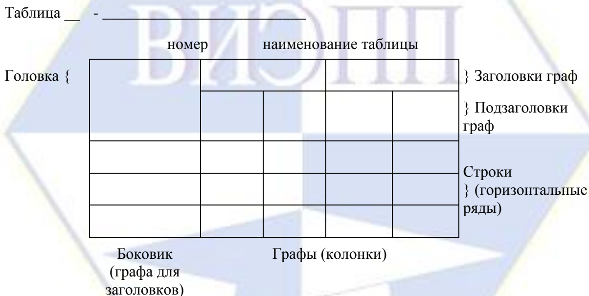
Рисунок 2 – Макет таблицы

Цифровой материал, как правило, оформляют в виде таблиц. Таблица содержит три вида заголовков: общий, верхние и боковые. Общий заголовок отражает содержание всей таблицы (к какому месту и времени она относится), располагается над ее макетом и является внешним заголовком. Верхние заголовки характеризуют содержание граф, а боковые - строк. Они являются внутренними заголовками. Таблица оформляется в соответствии с рисунком 2.