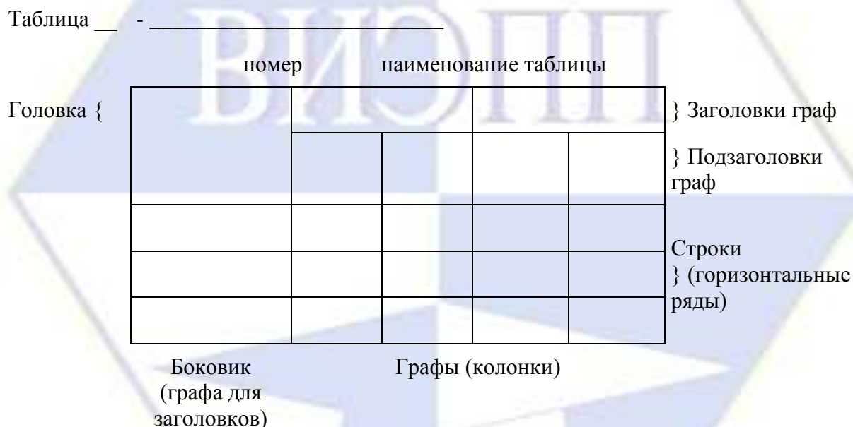
Рисунок 2 – Макет таблицы

Цифровой материал, как правило, оформляют в виде таблиц. Таблица содержит три вида заголовков: общий, верхние и боковые. Общий заголовок отражает содержание всей таблицы (к какому месту и времени она относится), располагается над ее макетом и является внешним заголовком. Верхние заголовки характеризуют содержание граф, а боковые - строк. Они являются внутренними заголовками. Таблица оформляется в соответствии с рисунком 2.