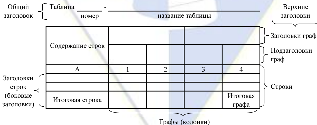
Рисунок 4 – Остов (основа) таблицы

Цифровой материал, как правило, оформляют в виде таблиц. Таблица содержит три вида заголовков: общий, верхние и боковые (рис. 4). Общий заголовок отражает содержание всей таблицы (к какому месту и времени она относится), располагается над ее макетом и является внешним заголовком. Верхние заголовки характеризуют содержание граф, а боковые - строк. Они являются внутренними заголовками.