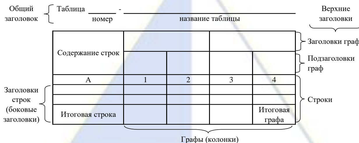
Рисунок 4 – Остов (основа) таблицы

заголовков: общий, верхние и боковые (рис. 4). Общий заголовок отражает содержание всей таблицы (к какому месту и времени она относится), располагается над ее макетом и является внешним заголовком. Верхние заголовки характеризуют содержание граф, а боковые - строк. Они являются внутренними заголовками.