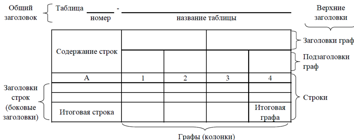
Рисунок 3 - Остов (основа) таблицы

Остов таблицы, заполненный заголовками, образует ее макет. Если на пересечении граф и строк записать цифры, то получается полная таблица. Таблицы, используемые в работе, размещают под текстом, в котором впервые дана ссылка на них, или на следующей странице, а при необходимости - в приложении.