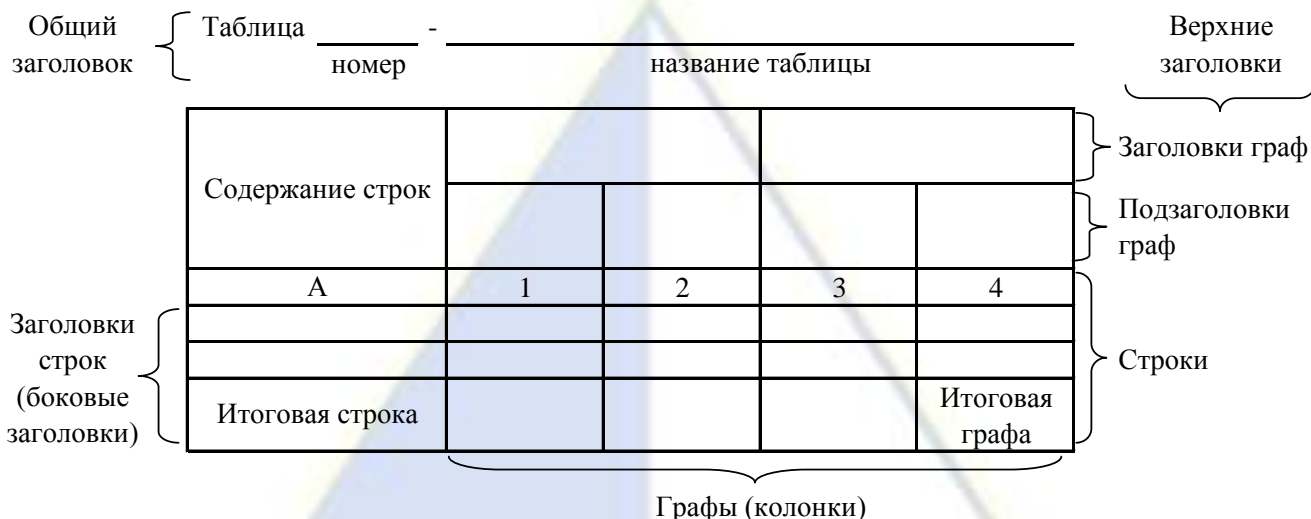
Рисунок 2 – Остов (основа) таблицы

Таблицы каждого приложения обозначают отдельной нумерацией арабскими цифрами с добавлением перед цифрой обозначения приложения. Например, «Таблица В.1», если она приведена в приложении В.