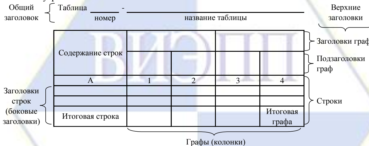
Рисунок 4 – Остов (основа) таблицы

Цифровой материал, как правило, оформляют в виде таблиц. Таблица содержит три вида заголовков: общий, верхние и боковые (рис. 4). Общий заголовок отражает содержание всей таблицы (к какому месту и времени она относится), располагается над ее макетом и является внешним заголовком. Верхние заголовки характеризуют содержание граф, а боковые - строк. Они являются внутренними заголовками.