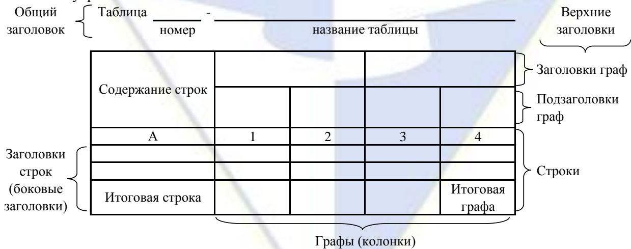
Рисунок 4 – Остов (основа) таблицы

Цифровой материал, как правило, оформляют в виде таблиц. Таблица содержит три вида заголовков: общий, верхние и боковые (рис. 4). Общий заголовок отражает содержание всей таблицы (к какому месту и времени она относится), располагается над ее макетом и является внешним заголовком. Верхние заголовки характеризуют содержание граф, а боковые - строк. Они являются внутренними заголовками.