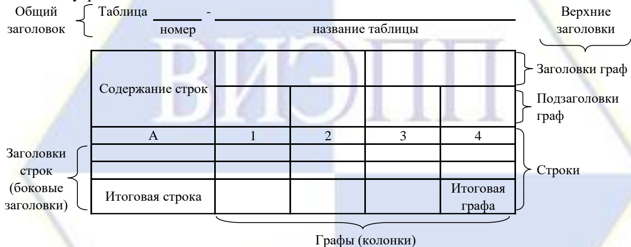
Рисунок 4 – Остов (основа) таблицы

Цифровой материал, как правило, оформляют в виде таблиц. Таблица содержит три вида заголовков: общий, верхние и боковые (рис. 4). Общий заголовок отражает содержание всей таблицы (к какому месту и времени она относится), располагается над ее макетом и является внешним заголовком. Верхние заголовки характеризуют содержание граф, а боковые - строк. Они являются внутренними заголовками.