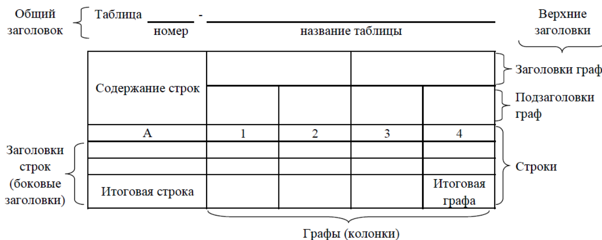
Рисунок 3 - Остов (основа) таблицы

боковые - строк. Они являются внутренними заголовками.