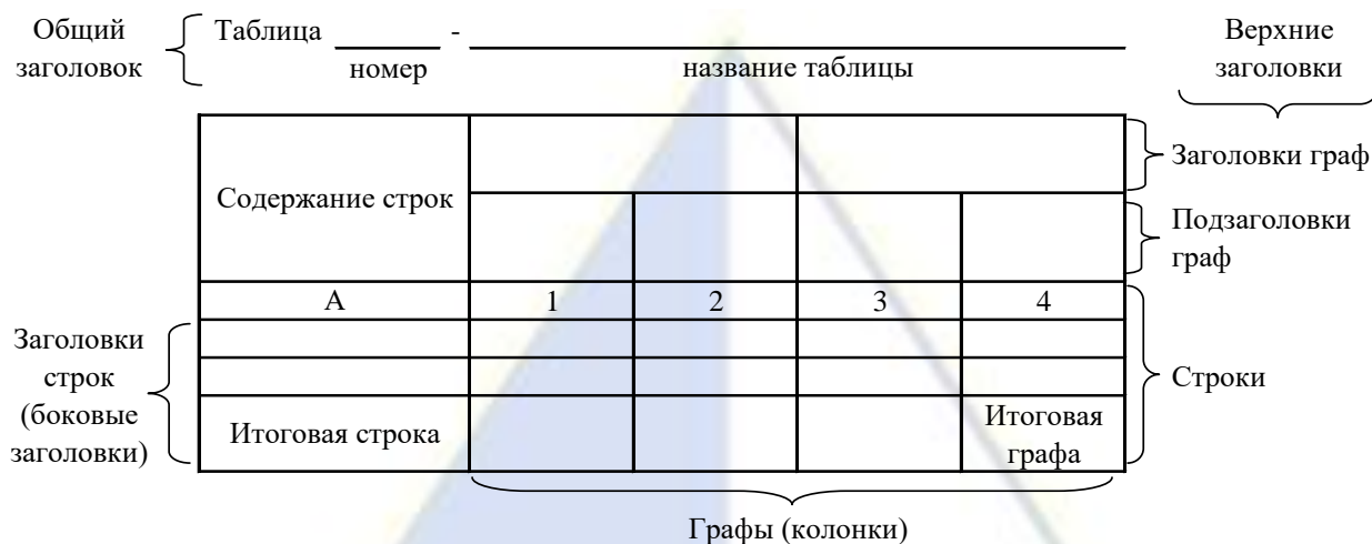
Рисунок 2 – Остов (основа) таблицы

Остов таблицы, заполненный заголовками, образует ее макет. Если на пересечении граф и строк записать цифры, то получается полная таблица.