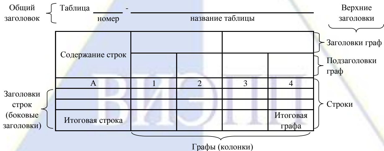
Рисунок 4 – Остов (основа) таблицы

Цифровой материал, как правило, оформляют в виде таблиц. Таблица содержит три вида заголовков: общий, верхние и боковые (рис. 4). Общий заголовок отражает содержание всей таблицы (к какому месту и времени она относится), располагается над ее макетом и является внешним заголовком. Верхние заголовки характеризуют содержание граф, а боковые - строк. Они являются внутренними заголовками.