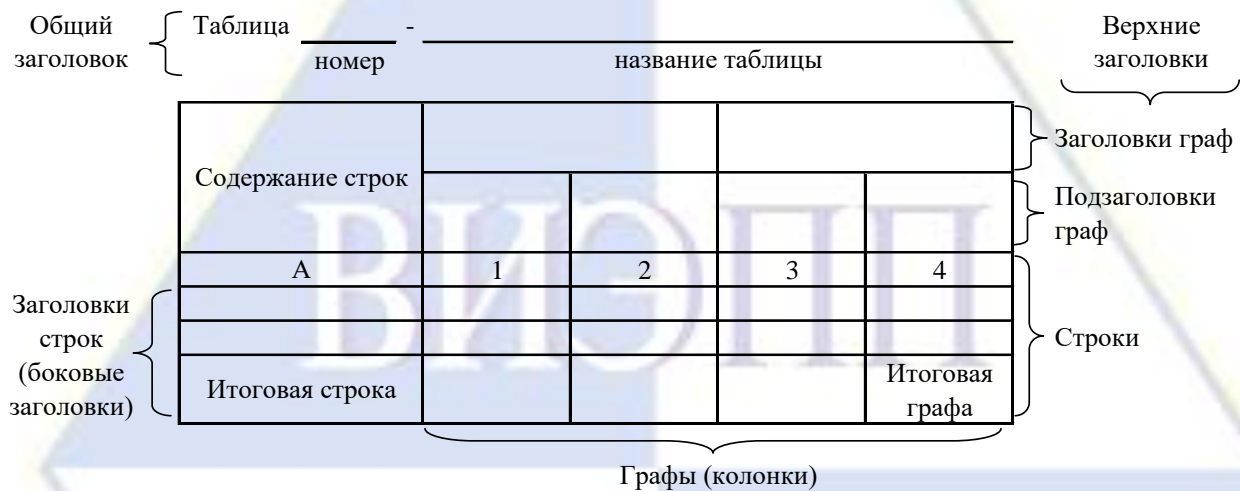
Рисунок 4 – Остов (основа) таблицы

Цифровой материал, как правило, оформляют в виде таблиц. Таблица содержит три вида заголовков: общий, верхние и боковые (рис. 4). Общий заголовок отражает содержание всей таблицы (к какому месту и времени она относится), располагается над ее макетом и является внешним заголовком. Верхние заголовки характеризуют содержание граф, а боковые - строк. Они являются внутренними заголовками.