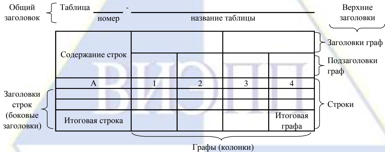
Рисунок 4 – Остов (основа) таблицы

Цифровой материал, как правило, оформляют в виде таблиц. Таблица содержит три вида заголовков: общий, верхние и боковые (рис. 4). Общий заголовок отражает содержание всей таблицы (к какому месту и времени она относится), располагается над ее макетом и является внешним заголовком. Верхние заголовки характеризуют содержание граф, а боковые - строк. Они являются внутренними заголовками.