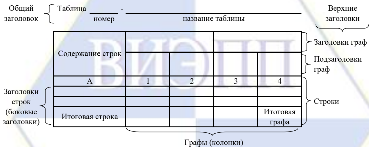
Рисунок 4 – Остов (основа) таблицы

Цифровой материал, как правило, оформляют в виде таблиц. Таблица содержит три вида заголовков: общий, верхние и боковые (рис. 4). Общий заголовок отражает содержание всей таблицы (к какому месту и времени она относится), располагается над ее макетом и является внешним заголовком. Верхние заголовки характеризуют содержание граф, а боковые - строк. Они являются внутренними заголовками.