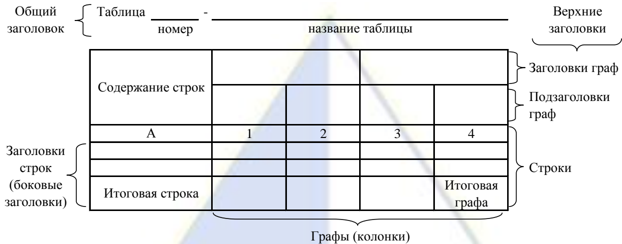
Рисунок 4 – Остов (основа) таблицы

Остов таблицы, заполненный заголовками, образует ее макет. Если на пересечении граф и строк записать цифры, то получается полная таблица.