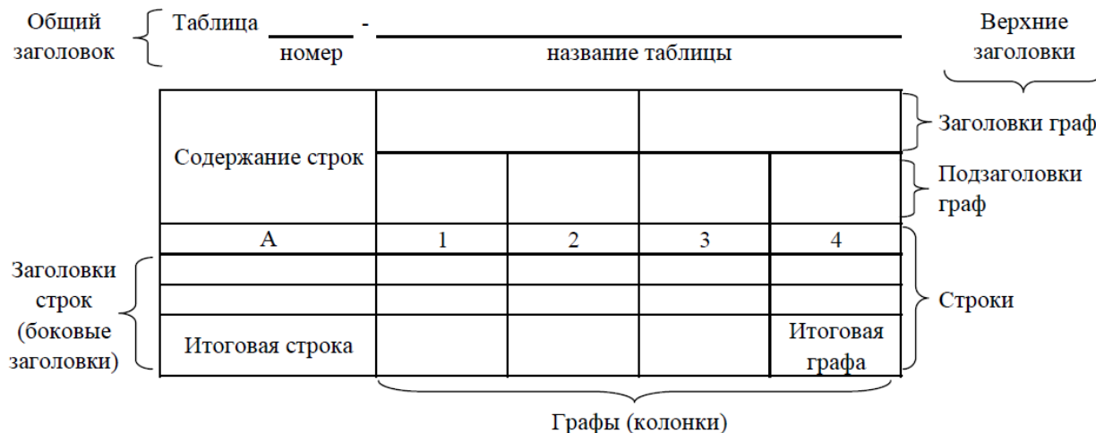
Рисунок 3 - Остов (основа) таблицы

Цифровой материал, как правило, оформляют в виде таблиц. Таблица содержит три вида заголовков: общий, верхние и боковые (рис. 3). Общий заголовок отражает содержание всей таблицы (к какому месту и времени она относится), располагается над ее макетом и является внешним заголовком. Верхние заголовки характеризуют содержание граф, а боковые - строк. Они являются внутренними заголовками.