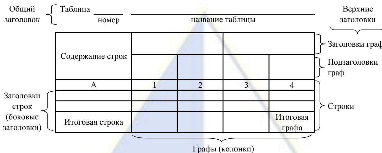
Рисунок 4 – Остов (основа) таблицы

Остов таблицы, заполненный заголовками, образует ее макет. Если на пересечении граф и строк записать цифры, то получается полная таблица.