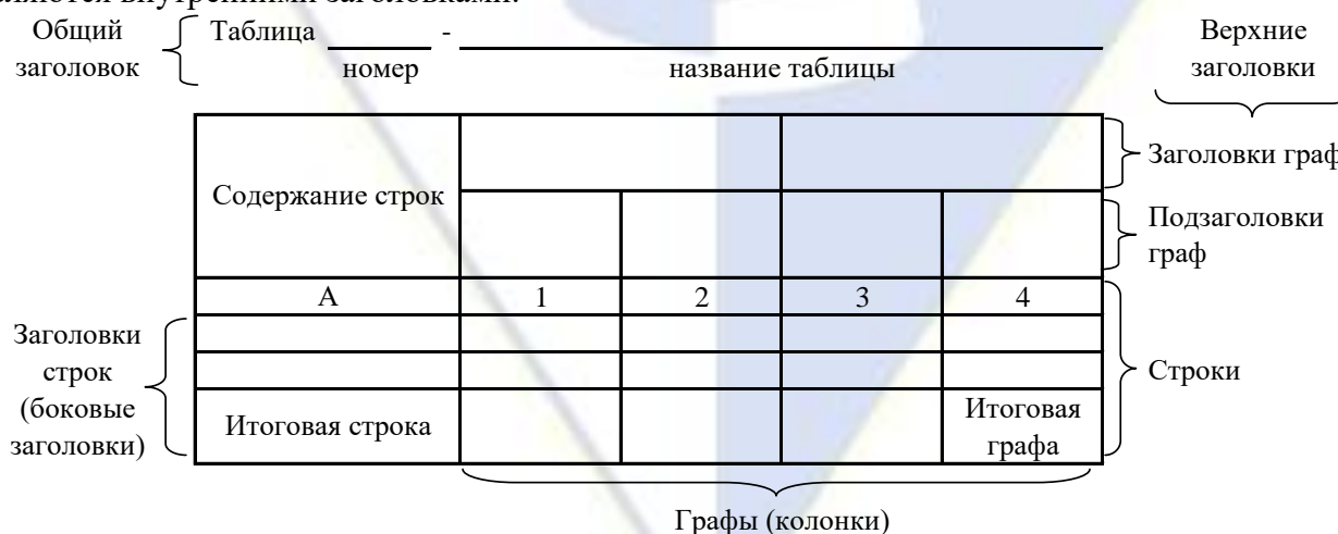
Рисунок 2 – Остов (основа) таблицы

Цифровой материал, как правило, оформляют в виде таблиц. Таблица содержит три вида заголовков: общий, верхние и боковые (рис. 2). Общий заголовок отражает содержание всей таблицы (к какому месту и времени она относится), располагается над ее макетом и является внешним заголовком. Верхние заголовки характеризуют содержание граф, а боковые - строк. Они являются внутренними заголовками.