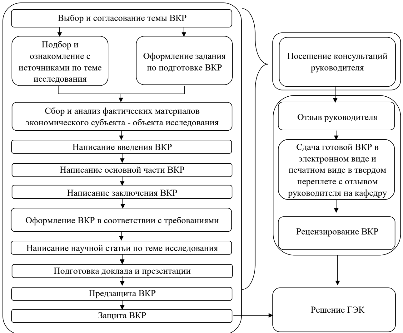
Рисунок 2 - Этапы выполнения выпускной квалификационной работы