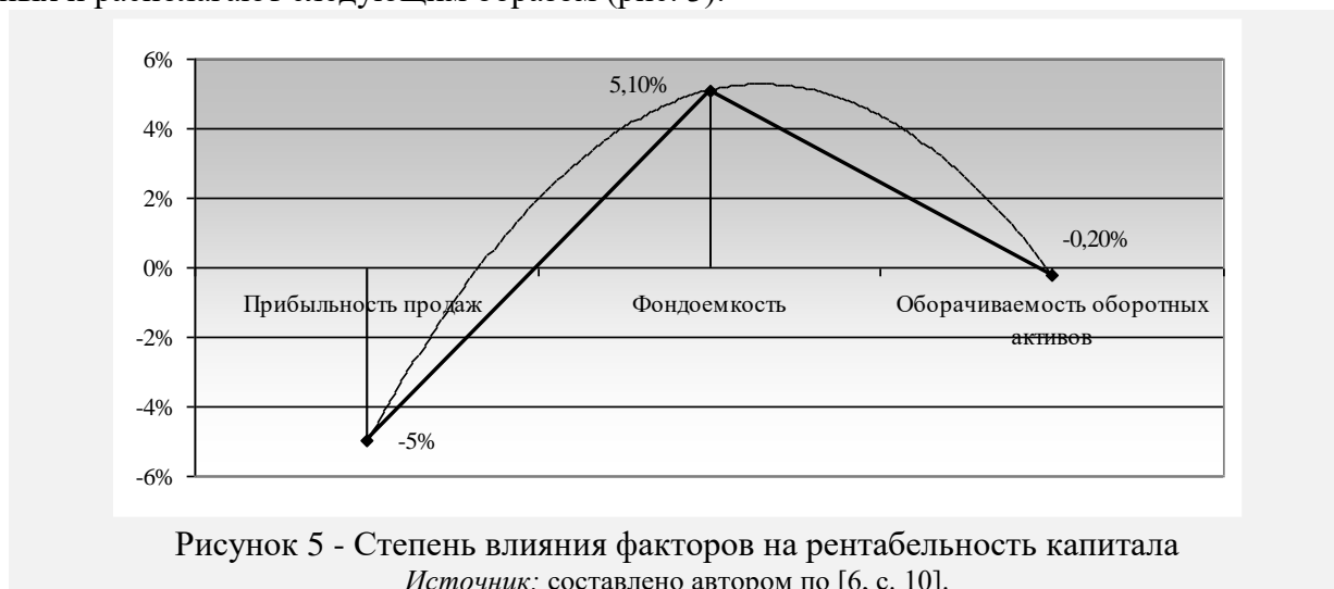
Рисунок 5 - Степень влияния факторов на рентабельность капитала

Иллюстрации должны иметь наименование и, если необходимо, пояснительные данные (подрисуночный текст). Слово «Рисунок» и наименование помещают после пояснительных данных и располагают следующим образом (рис. 3):