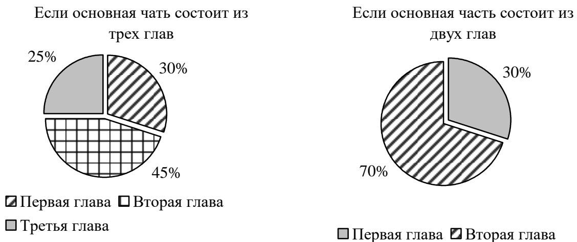
Рисунок 1 - Структура основной части выпускной квалификационной работы

Для введения отводится не более пяти страниц, заключения - трех-пяти страниц. Первая глава должна составлять 30%, вторая – 45%, третья - 25% основной части. В случае если основная часть состоит из двух глав, то первая глава должна составлять 30%, а вторая – 70% (рис. 1).