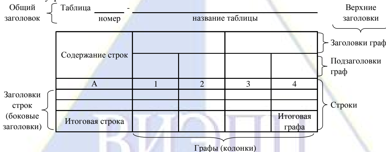
Рисунок 2 – Остов (основа) таблицы

Цифровой материал, как правило, оформляют в виде таблиц. Таблица содержит три вида заголовков: общий, верхние и боковые (рис. 2). Общий заголовок отражает содержание всей таблицы (к какому месту и времени она относится), располагается над ее макетом и является внешним заголовком. Верхние заголовки характеризуют содержание граф, а боковые - строк. Они являются внутренними заголовками.