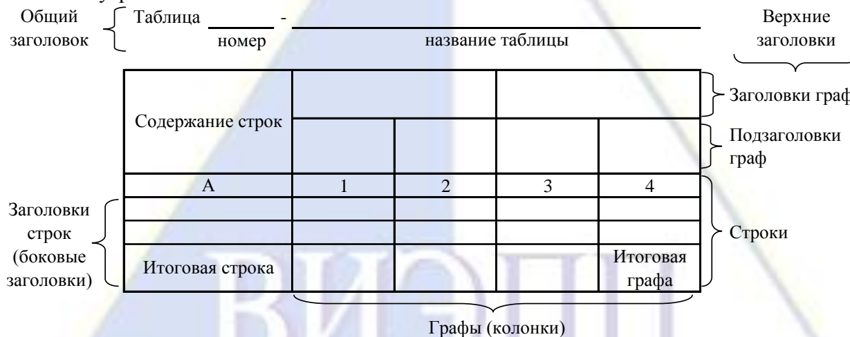
Рисунок 2 – Остов (основа) таблицы

Цифровой материал, как правило, оформляют в виде таблиц. Таблица содержит три вида заголовков: общий, верхние и боковые (рис. 2). Общий заголовок отражает содержание всей таблицы (к какому месту и времени она относится), располагается над ее макетом и является внешним заголовком. Верхние заголовки характеризуют содержание граф, а боковые - строк. Они являются внутренними заголовками.