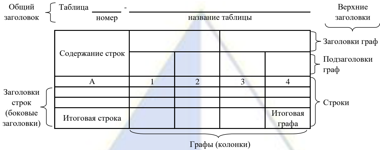
Рисунок 2 – Остов (основа) таблицы

Остов таблицы, заполненный заголовками, образует ее макет. Если на пересечении граф и строк записать цифры, то получается полная таблица.