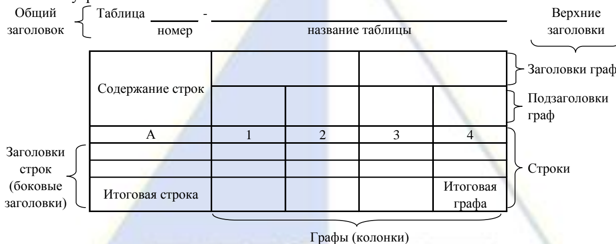
Рисунок 2 – Остов (основа) таблицы

Цифровой материал, как правило, оформляют в виде таблиц. Таблица содержит три вида заголовков: общий, верхние и боковые (рис. 2). Общий заголовок отражает содержание всей таблицы (к какому месту и времени она относится), располагается над ее макетом и является внешним заголовком. Верхние заголовки характеризуют содержание граф, а боковые - строк. Они являются внутренними заголовками.