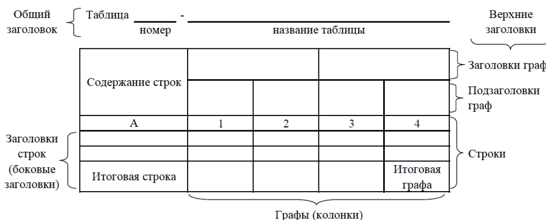
Рисунок 2 - Остов (основа) таблицы

Цифровой материал, как правило, оформляют в виде таблиц. Таблица содержит три вида заголовков: общий, верхние и боковые (рис. 2). Общий заголовок отражает содержание всей таблицы (к какому месту и времени она относится), располагается над ее макетом и является внешним заголовком. Верхние заголовки характеризуют содержание граф, а боковые - строк. Они являются внутренними заголовками.