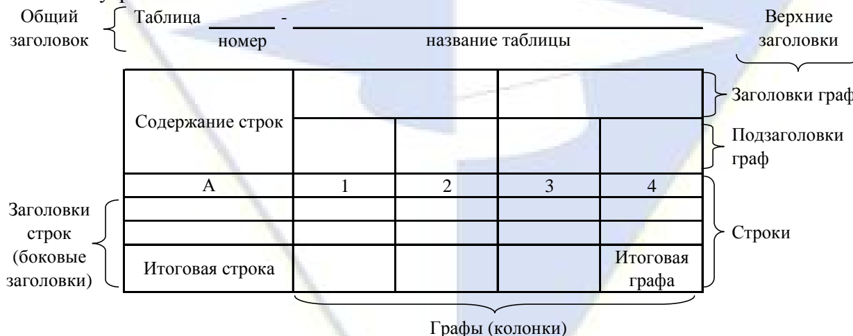
Рисунок 2 – Остов (основа) таблицы

Цифровой материал, как правило, оформляют в виде таблиц. Таблица содержит три вида заголовков: общий, верхние и боковые (рис. 2). Общий заголовок отражает содержание всей таблицы (к какому месту и времени она относится), располагается над ее макетом и является внешним заголовком. Верхние заголовки характеризуют содержание граф, а боковые - строк. Они являются внутренними заголовками.