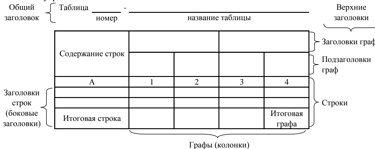
Рисунок 2 – Остов (основа) таблицы

Цифровой материал, как правило, оформляют в виде таблиц. Таблица содержит три вида заголовков: общий, верхние и боковые (рис. 2). Общий заголовок отражает содержание всей таблицы (к какому месту и времени она относится), располагается над ее макетом и является внешним заголовком. Верхние заголовки характеризуют содержание граф, а боковые - строк. Они являются внутренними заголовками.