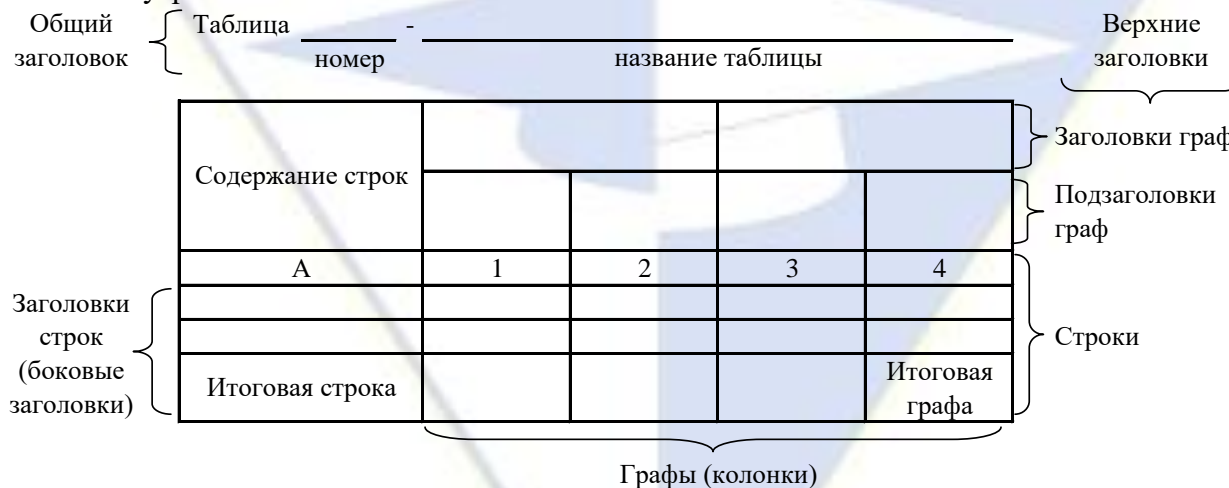
Рисунок 2 – Остов (основа) таблицы

Цифровой материал, как правило, оформляют в виде таблиц. Таблица содержит три вида заголовков: общий, верхние и боковые (рис. 2). Общий заголовок отражает содержание всей таблицы (к какому месту и времени она относится), располагается над ее макетом и является внешним заголовком. Верхние заголовки характеризуют содержание граф, а боковые - строк. Они являются внутренними заголовками.