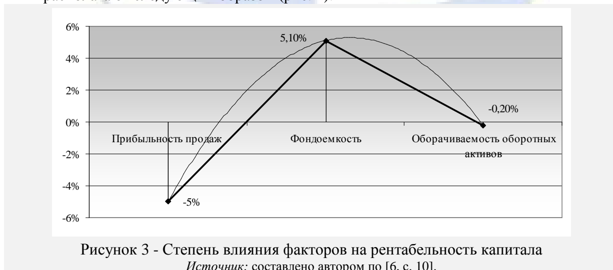
Рисунок 1 – Пример оформления рисунка.

Иллюстрации должны иметь наименование и, если необходимо, пояснительные данные (подрисуночный текст). Слово «Рисунок» и наименование помещают после пояснительных данных и располагают следующим образом (рис. 1):