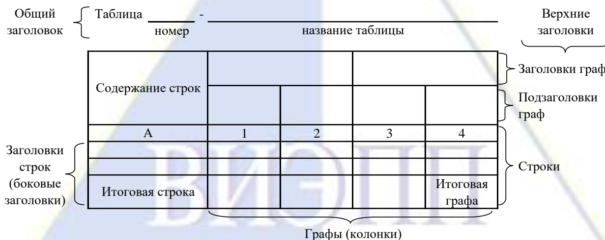
Рисунок 4 – Остов (основа) таблицы

Цифровой материал, как правило, оформляют в виде таблиц. Таблица содержит три вида заголовков: общий, верхние и боковые (рис. 4). Общий заголовок отражает содержание всей таблицы (к какому месту и времени она относится), располагается над ее макетом и является внешним заголовком. Верхние заголовки характеризуют содержание граф, а боковые - строк. Они являются внутренними заголовками.