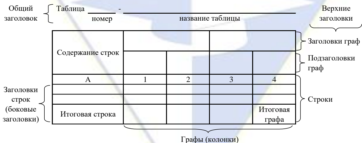
Рисунок 4 – Остов (основа) таблицы

Цифровой материал, как правило, оформляют в виде таблиц. Таблица содержит три вида заголовков: общий, верхние и боковые (рис. 4). Общий заголовок отражает содержание всей таблицы (к какому месту и времени она относится), располагается над ее макетом и является внешним заголовком. Верхние заголовки характеризуют содержание граф, а боковые - строк. Они являются внутренними заголовками.