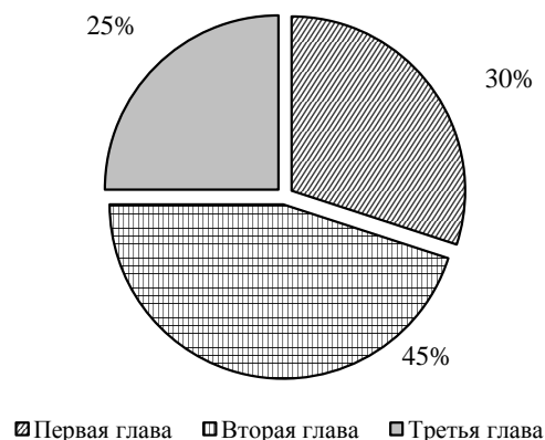
Рисунок 1 – Структура основной части выпускной квалификационной работы

Для введения отводится не более пяти страниц, заключения - трех-пяти страниц. Первая глава должна составлять 30%, вторая – 45%, третья - 25% основной части. (рис. 1).