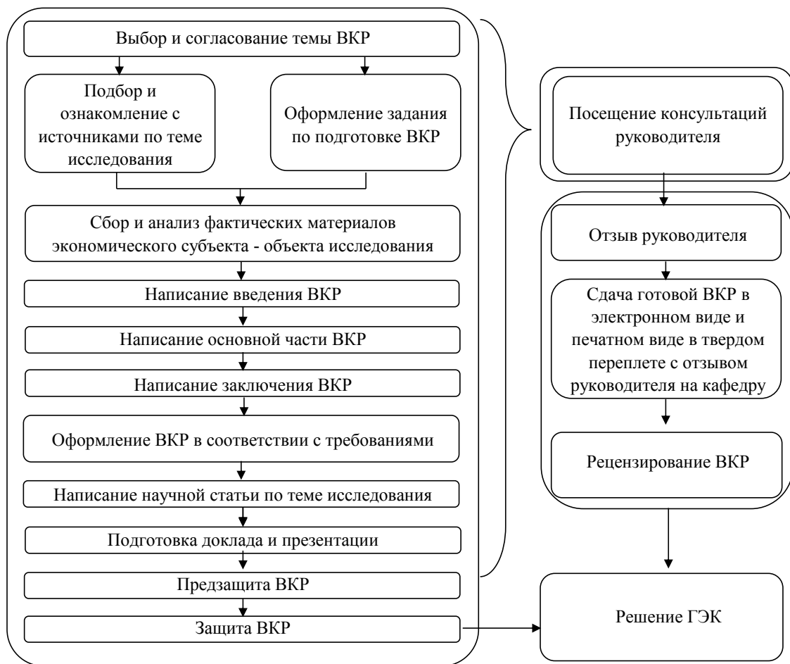
Рисунок 2 – Этапы выполнения выпускной квалификационной работы

Выполнение выпускной квалификационной работы осуществляется по этапам, представленным на рисунке 2.