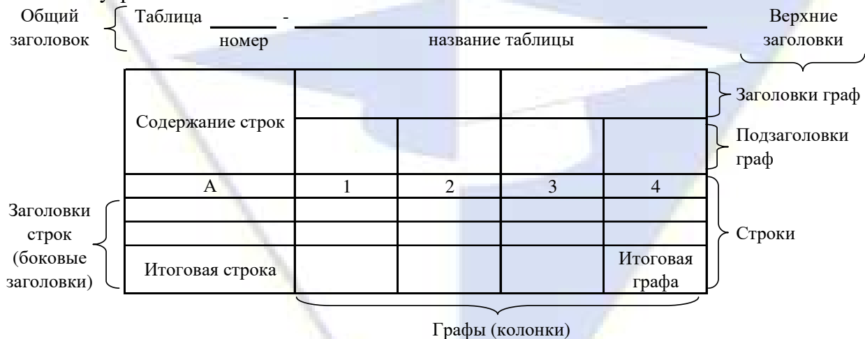
Рисунок 4 – Остов (основа) таблицы

Цифровой материал, как правило, оформляют в виде таблиц. Таблица содержит три вида заголовков: общий, верхние и боковые (рис. 4). Общий заголовок отражает содержание всей таблицы (к какому месту и времени она относится), располагается над ее макетом и является внешним заголовком. Верхние заголовки характеризуют содержание граф, а боковые - строк. Они являются внутренними заголовками.