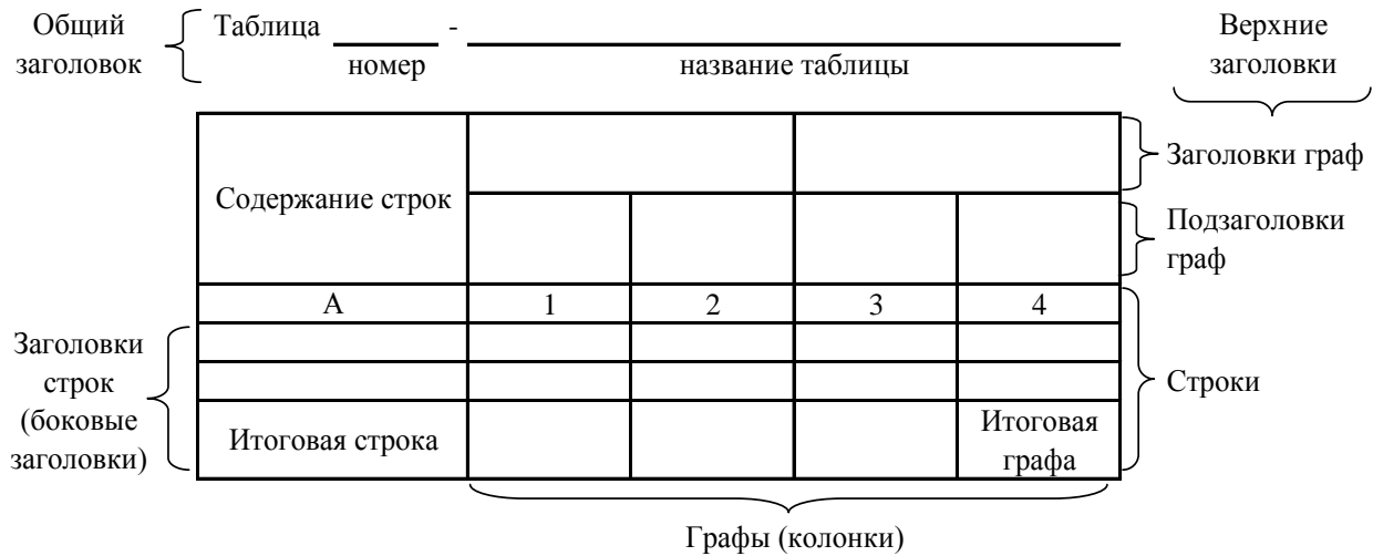
Рисунок 2 – Остов (основа) таблицы

заголовков: общий, верхние и боковые (рис. 2).