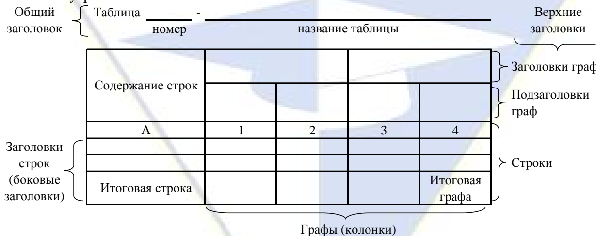
Рисунок 2 – Остов (основа) таблицы

Цифровой материал, как правило, оформляют в виде таблиц. Таблица содержит три вида заголовков: общий, верхние и боковые (рис. 2). Общий заголовок отражает содержание всей таблицы (к какому месту и времени она относится), располагается над ее макетом и является внешним заголовком. Верхние заголовки характеризуют содержание граф, а боковые - строк. Они являются внутренними заголовками.