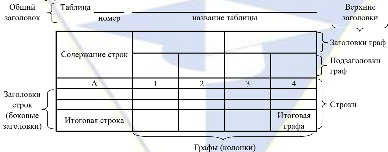
Рисунок 4 – Остов (основа) таблицы

Цифровой материал, как правило, оформляют в виде таблиц. Таблица содержит три вида заголовков: общий, верхние и боковые (рис. 4). Общий заголовок отражает содержание всей таблицы (к какому месту и времени она относится), располагается над ее макетом и является внешним заголовком. Верхние заголовки характеризуют содержание граф, а боковые - строк. Они являются внутренними заголовками.