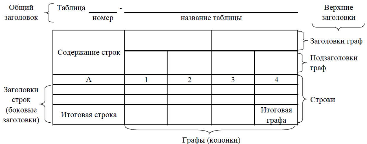
Рисунок 3 - Остов (основа) таблицы

Остов таблицы, заполненный заголовками, образует ее макет. Если на пересечении граф и строк записать цифры, то получается полная таблица. Таблицы, используемые в работе, размещают под текстом, в котором впервые дана ссылка на них, или на следующей странице, а при необходимости - в приложении.