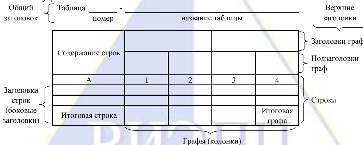
Рисунок 4 – Остов (основа) таблицы

Цифровой материал, как правило, оформляют в виде таблиц. Таблица содержит три вида заголовков: общий, верхние и боковые (рис. 4). Общий заголовок отражает содержание всей таблицы (к какому месту и времени она относится), располагается над ее макетом и является внешним заголовком. Верхние заголовки характеризуют содержание граф, а боковые - строк. Они являются внутренними заголовками.