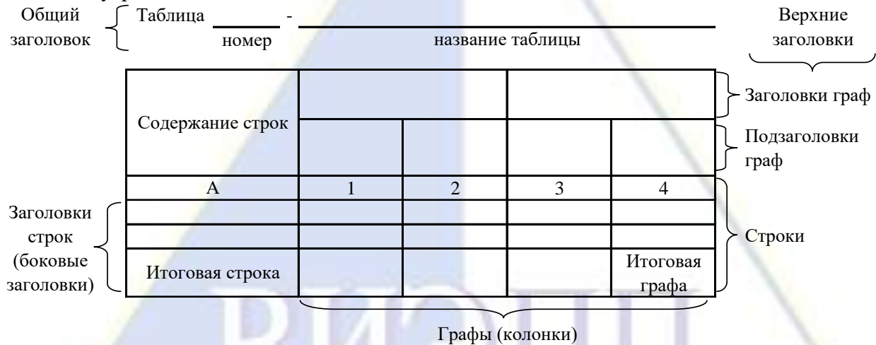
Рисунок 4 – Остов (основа) таблицы

Цифровой материал, как правило, оформляют в виде таблиц. Таблица содержит три вида заголовков: общий, верхние и боковые (рис. 4). Общий заголовок отражает содержание всей таблицы (к какому месту и времени она относится), располагается над ее макетом и является внешним заголовком. Верхние заголовки характеризуют содержание граф, а боковые - строк. Они являются внутренними заголовками.