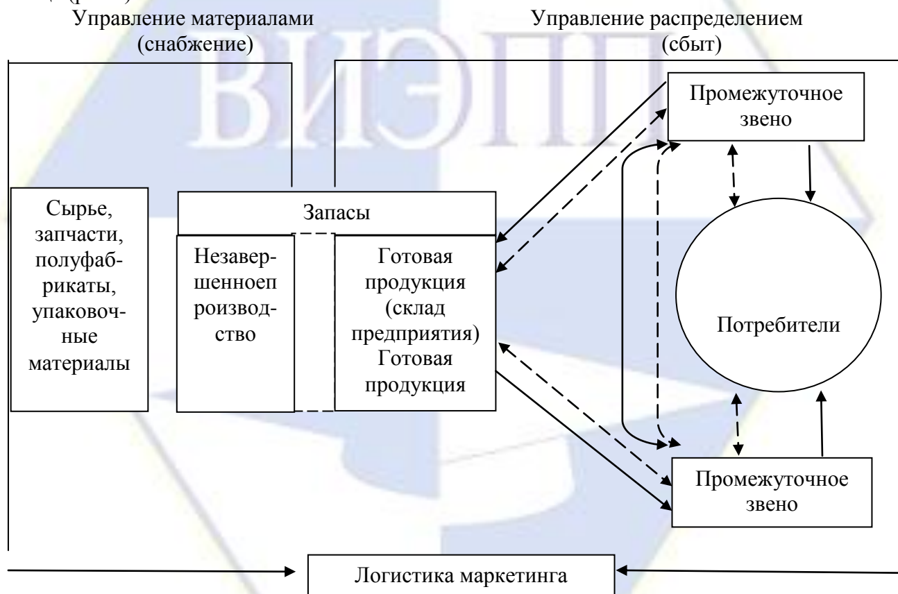
Рисунок 1 – Принципы логистической системы

Иллюстрации должны иметь наименование и, если необходимо, пояснительные данные (подрисуночный текст). Слово «Рисунок», его номер и через тире наименование помещают после пояснительных данных и располагают в центре под рисунком без точки в конце (рис.1).