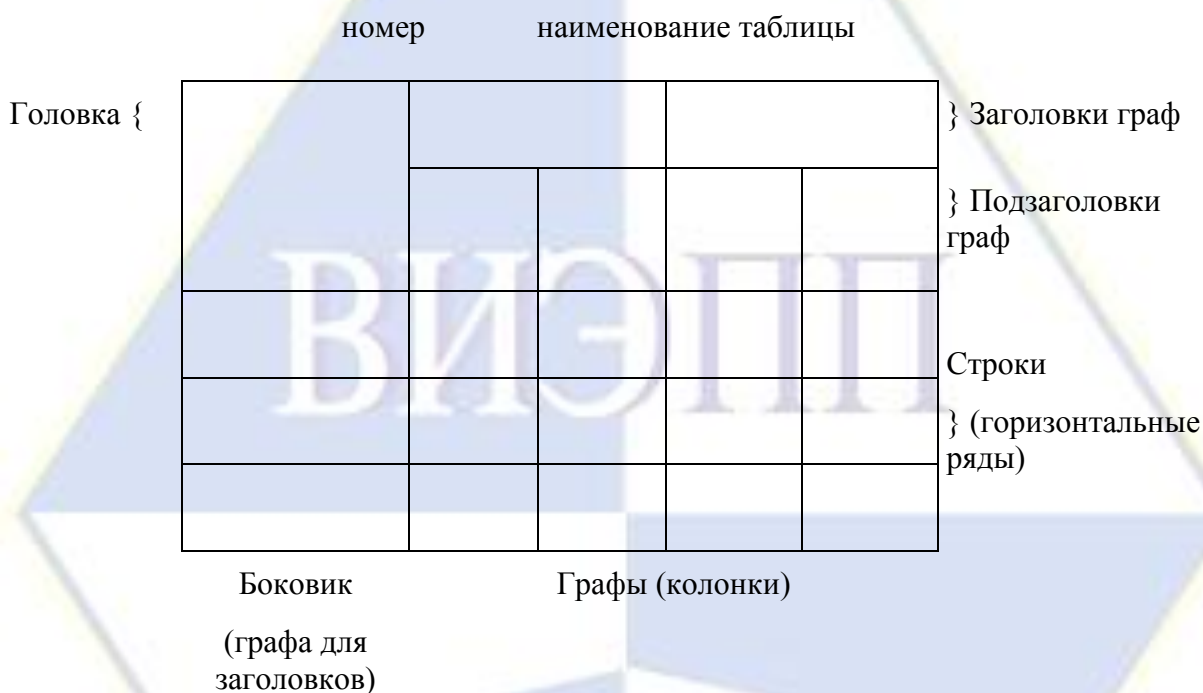
Рисунок 2 – Макет таблицы

Таблицы, за исключением таблиц приложений, следует нумеровать арабскими цифрами сквозной нумерацией.