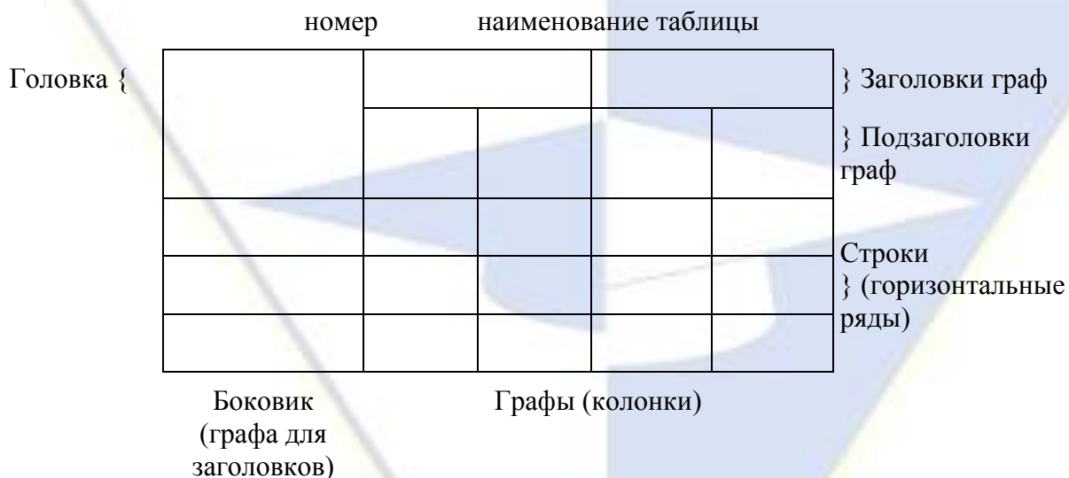
Рисунок 2 – Макет таблицы

Таблицы, за исключением таблиц приложений, следует нумеровать арабскими цифрами сквозной нумерацией.