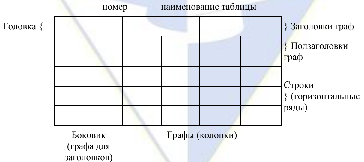
Рисунок 2 – Макет таблицы

Таблицы, за исключением таблиц приложений, следует нумеровать арабскими