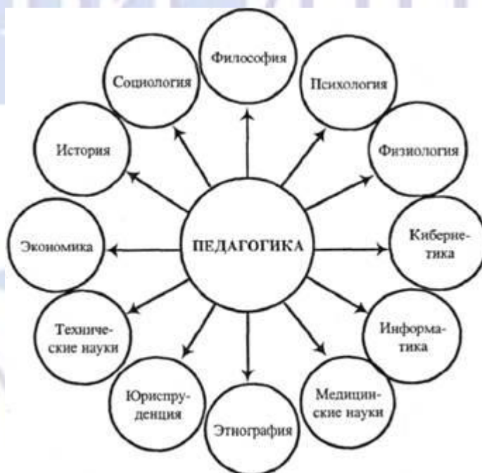
Рисунок 1 – Связь педагогики с другими науками

Иллюстрации должны иметь наименование и, если необходимо, пояснительные данные (подрисуночный текст). Слово «Рисунок», его номер и через тире наименование помещают после пояснительных данных и располагают в центре под рисунком без точки в конце (рис.1).