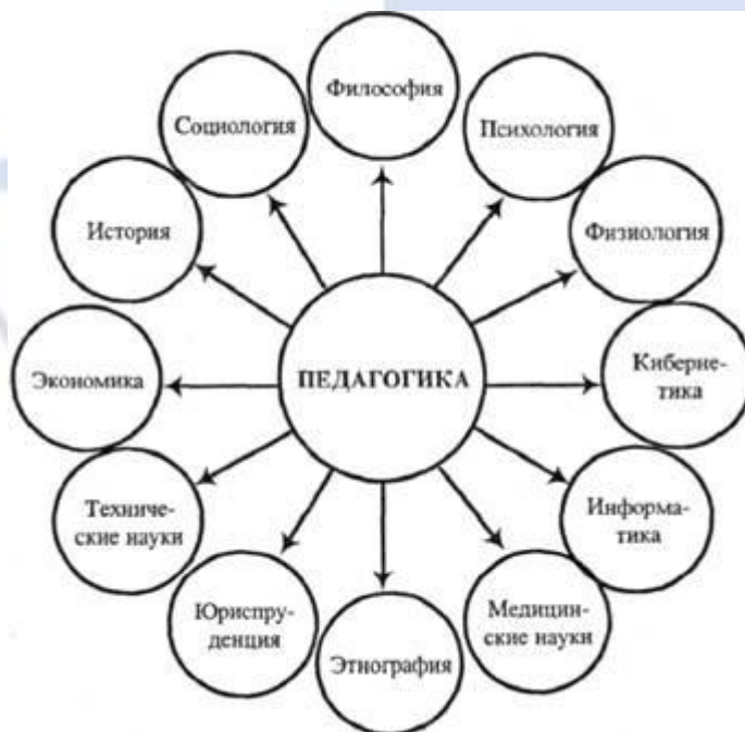
Рисунок 1 – Связь педагогики с другими науками

Иллюстрации должны иметь наименование и, если необходимо, пояснительные данные (подрисуночный текст). Слово «Рисунок», его номер и через тире наименование помещают после пояснительных данных и располагают в центре под рисунком без точки в конце (рис.1).